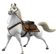
A barbada do Saudoso: Qarentona

Marcação do Saudoso: GO PETRUS GO (1) – LIONEL THE BEST (2) –REGAL VENUS (4).