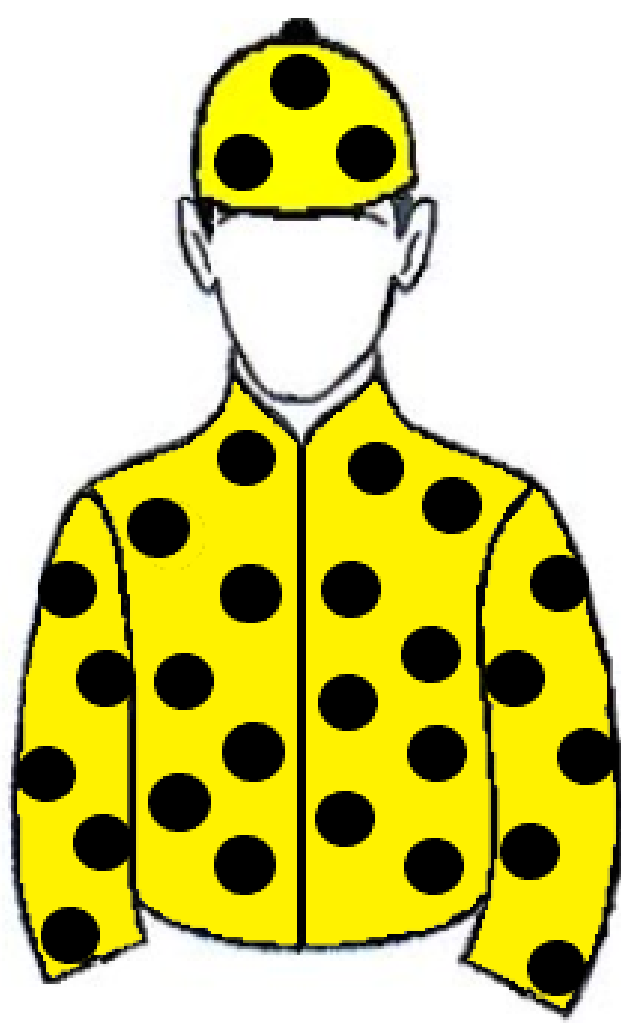
Haras Bongy PE

PROGRAMA OFICIAL DA 5ª CORRIDA – 24 de setembro de 2022 – SÁBADO