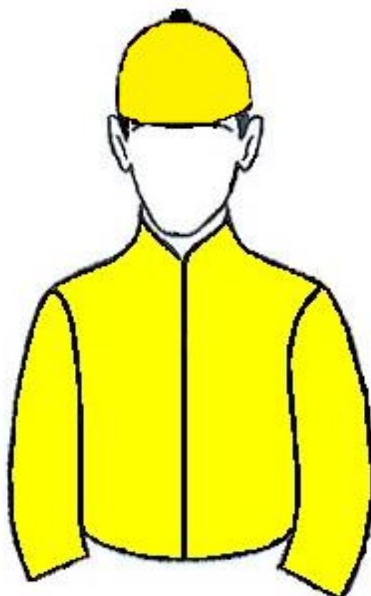
STUD BOA VIAGEM