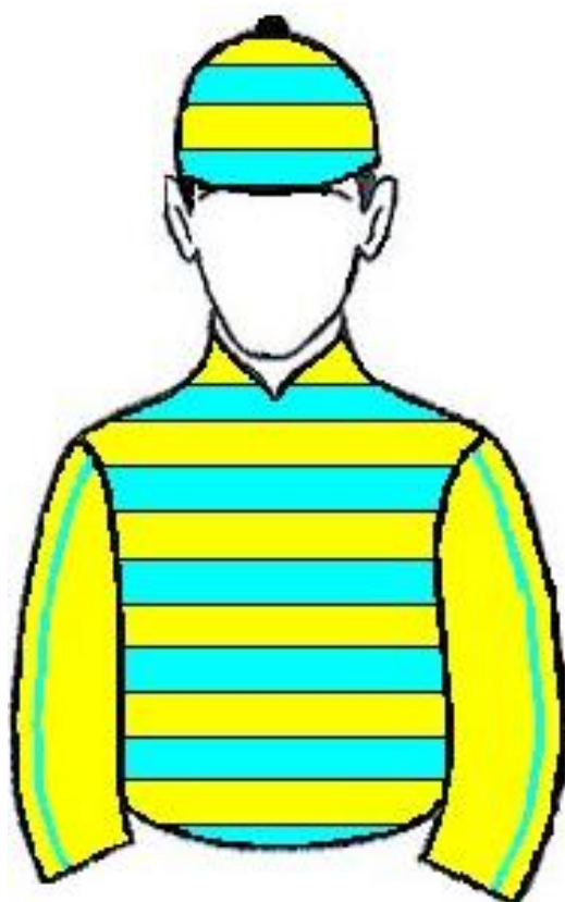
STUD SÃO JOSÉ DOS BASTIÕES