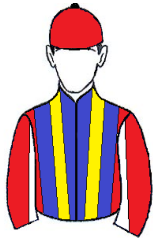
STUD LUANA E AMANDA MULECA

PROGRAMA OFICIAL DA 6ª CORRIDA – 10 de setembro de 2023 – SÁBADO