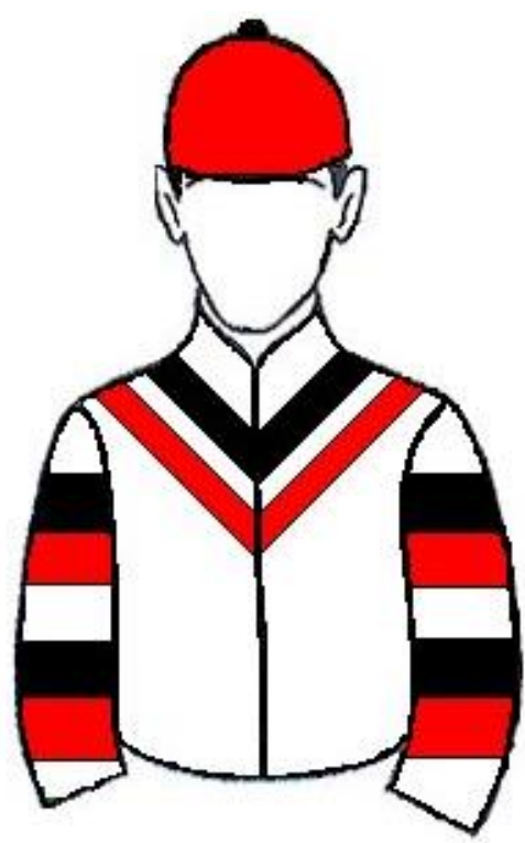
STUD CORTE REAL