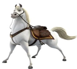
A barbada do Saudoso: OURINHO DA MAMÃE.

Marcação do Saudoso: IN FACT (2) – C’EST POSSIBLE (5) – GO PETRUS GO (1).