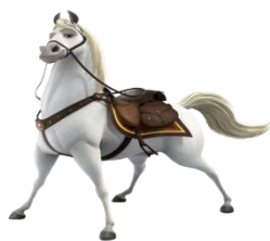
A barbada do Saudoso: Ourinho da Mamãe.