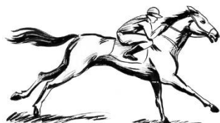
A barbada do Saudoso: Quarentona

Marcação do Saudoso: PINHÃO DO IGUASSU (6) – BEBÊ FORTUNA (5) – CAMPELIPE (3).