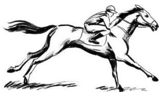
Barbada: Viking Celta.

Marcação do Saudoso: CASTRO FIDEL(1) – OLIMAC(5) – RENEWED HOPE.