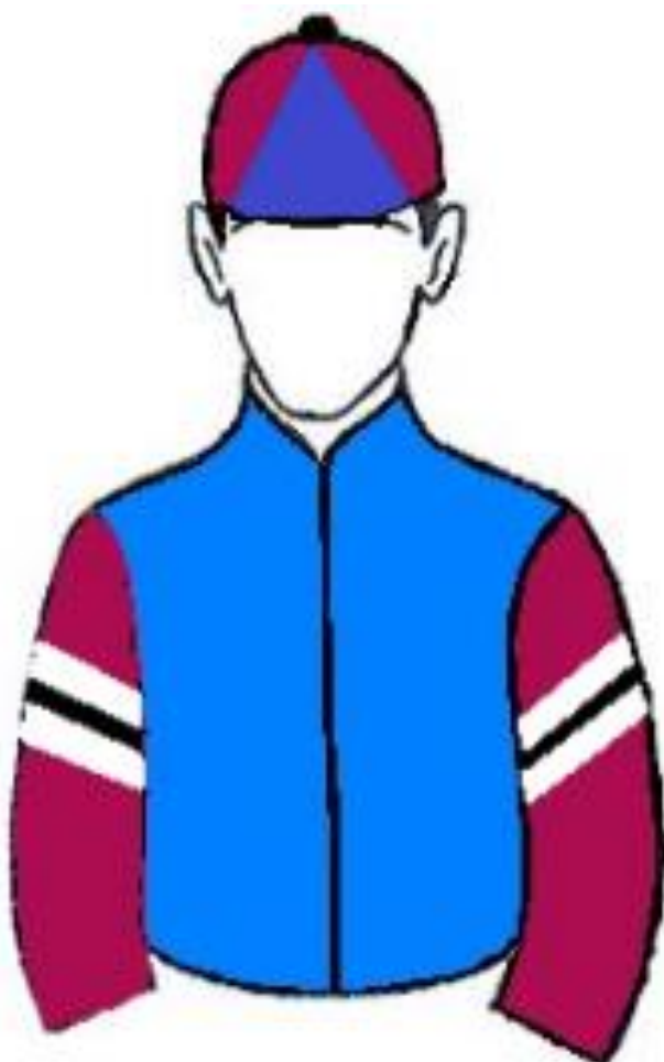
STUD C.M.L. RECIFE